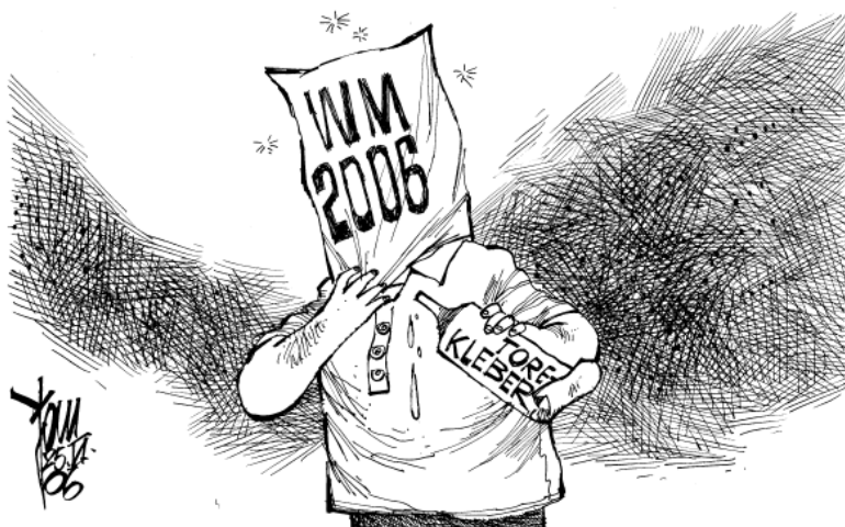
WM-SCHNÜFFELN: KEIN HARTZ IV, KEINE PROBLEME...

Für die kapitalistischen Herrscher heutzutage ist die WM in erster Linie ein milliardenschweres Geschäft. Für die Politiker dient sie als willkommene Ablenkung, mit deren Hilfe sie ohne den geringsten Widerstand die Kürzungen und weitere sozialen Einschnitte für uns beschließen können.