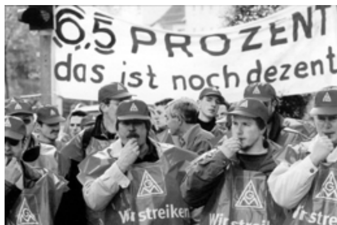
Foto aus der Tarifrunde 2002

Die Tarifrunde bietet die Chance, gemeinsam gegen die Willkür der Konzerne vorzugehen. Sie fürchten einen Streik: Volle Auftragsbücher bringen fette Profite für die Unternehmer und Aktionäre. Doch den Beschäftigten, die für diese Gewinne schufteten, bieten sie gerade einmal 2,5% plus Einmalzahlungen an! Die IG Metall muss die volle Kampfkraft der Beschäftigten nutzen, um diese Dreistigkeiten zurück zu schlagen: