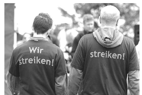
Foto: Kollegen bei Federal Mogul. Auch bei diesem Auto-Zulieferer wehrten sich Kollegen erfolgreich gegen Arbeitsplatzvernichtung.

Die Alternative fordert: 30-Stunden-Woche bei vollem Lohn!