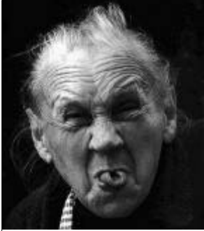
Lasst Euch nicht verarschen, vor allem nicht bei derWahl!