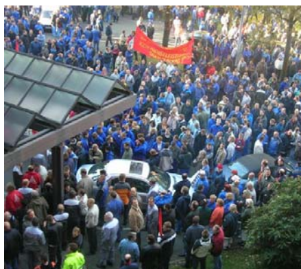
Aktion im Werk Bremen am 14.11.05

In größerem Ausmaß beweisen die Massenstreiks in Frankreich, Italien, Spanien, Griechenland, Belgien und anderswo, wie eine Mobilisierung auch bei schlechten Rahmenbedingungen möglich ist und Angriffe abgewehrt werden können.